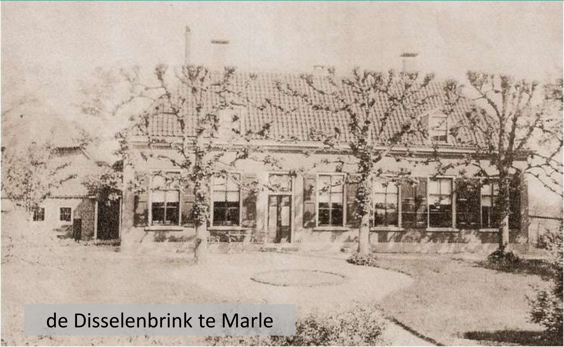
de Disselenbrink te Marle