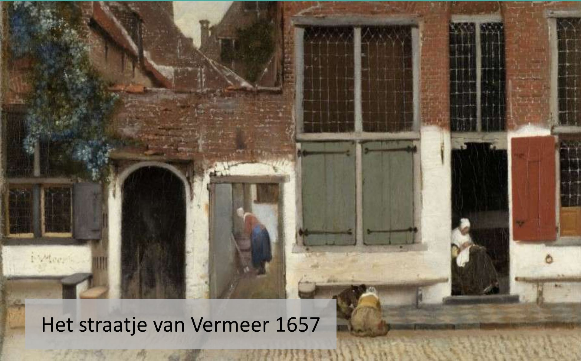
Het straatje van Vermeer 1657