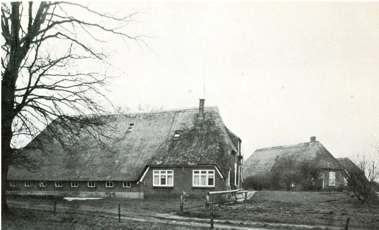
Boerderijen Koedijk

Het is mij niet helemaal duidelijk geworden hoe boerderij 't Lenderink is ontstaan. Wel is in de archieven te vinden dat deze boerderij in 1794 bewoond werd door Hendrik Lenderink. In dat jaar was hij pachter van deze boerderij die toebehoorde aan de H. Geest- of Groote Gasthuis en vanaf 1798 genoemd 'Het Groote en Voorster gasthuis' te Deventer. Uit archief gegevens is mij de bouwtijd helaas niet duidelijk geworden. De gebinten stammen uit een veel oudere tijd namelijk uit ca 1550.